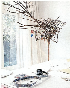
Oben: Komposition aus Holztellern und Pflanzenornamenten. Links: Auch Fundstücke wie dieser Ast verwandeln sich hier in Kunstwerke