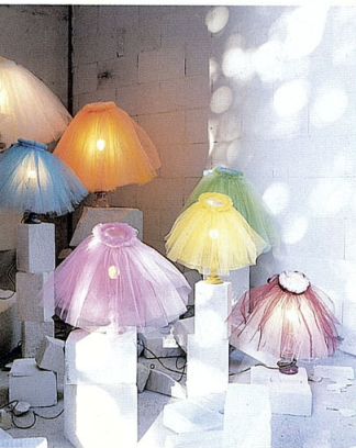
Oben: Wie Ballettröckchen wirken die bunten Lampenschirme aus zartem Tüll. Rechts: Installation oder Dekoration? Ein spärlich gedeckter Tisch als Kunstwerk