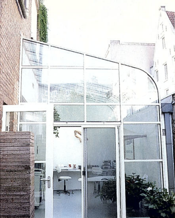
Oben: Eingang zum Atelier im Zentrum von Amsterdam. Unten: Wandfarbe und Objekt sind immer aufeinander abgestimmt